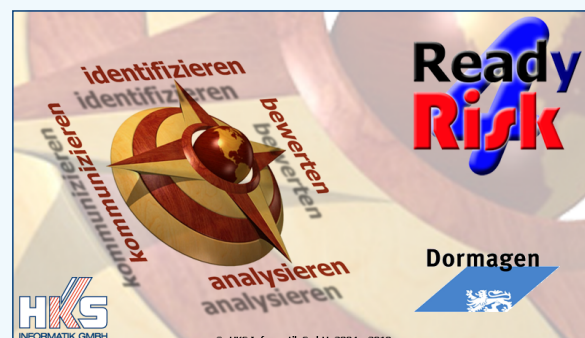
Ready4Risk-Begrüßungsbild der Stadt Dormagen

Der Risikokatalog steht wie gewohnt allen Neukunden von Ready4Risk zur Verfügung und wird, wie schon bei den Energieversorgern erfolgreich praktiziert, für alle Bestandskunden regelmäßig aktualisiert und erweitert, so dass ein gemeinsamer Wissenspool für alle Anwender in der kommunalen Verwaltung entsteht.